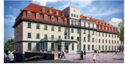
Senioren-Park carpe diem Bad Eilsen Harrlallee 1 31707 Bad Eilsen Tel.: 05722/9879-0 · Fax: -555 bad-eilsen@senioren-park.de