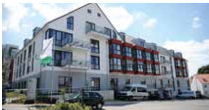
Senioren-Park carpe diem Bensberg Overather Straße 32 51429 Bergisch Gladbach Tel.: 02204/8308-0 · Fax: -555 bensberg@senioren-park.de